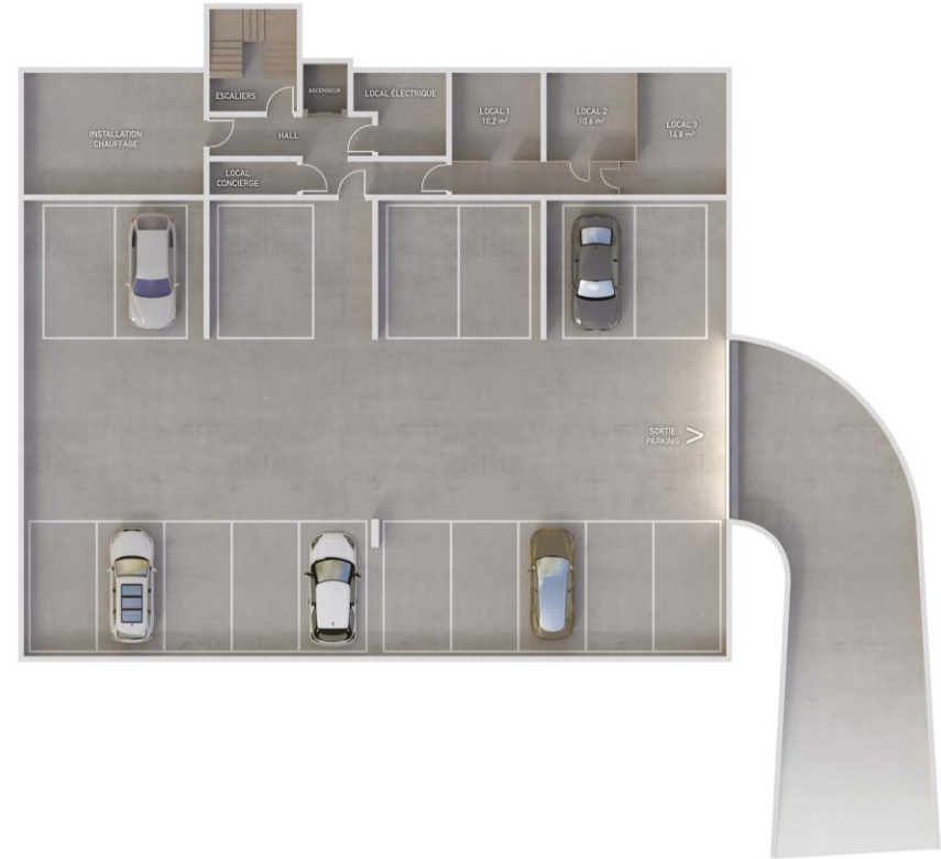
PLAN ETAGE : -1